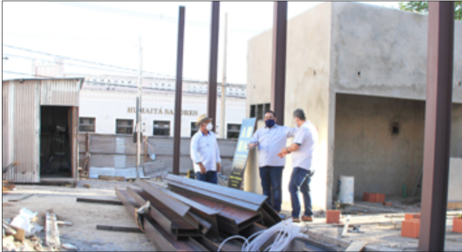
Nova cobertura do terminal rodoviário da Antônio Maria tem investimento de cerca de R$ 800 mil