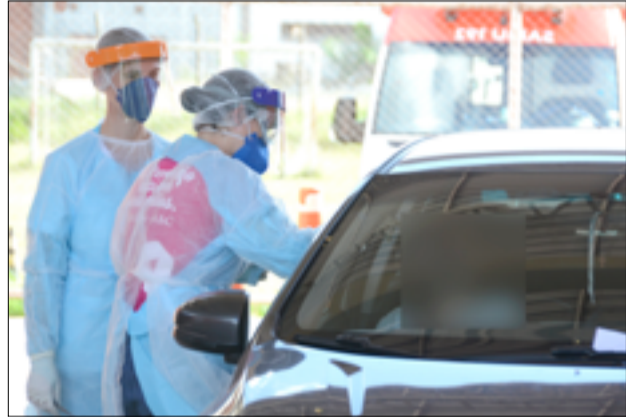
Já são oito testes positivos realizados pelo Drive Thru desde 11 de maio; sete em Corumbá e um em Ladário