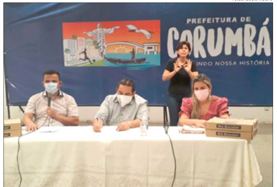
Em live na página do Facebook da Prefeitura, prefeito e secretário falaram sobre as aulas na Reme

A Secretaria Municipal de Educação trabalha com três possíveis calendários para encerrar o ano letivo de 2020. Se as atividades forem retomadas em julho, vai ser possível o término ainda este ano. Mas, se as aulas voltarem à normalidade em agosto ou setembro, é prová-