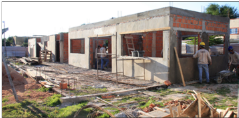
Capela terá duas salas para velórios, salas administrativas e de espera e banheiros

O espaço da Capela Mortuária Municipal, localizado atrás do Cemitério Santa Cruz, terá duas salas para velórios, salas administrativas e de espera e banheiros.