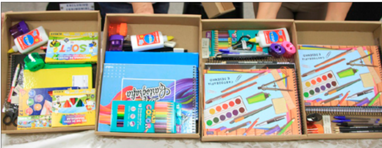
Kits escolares que começam a ser entregues na segunda-feira nas unidades de ensino, conforme cronograma para evitar aglomeração

Corumbá tem aproximadamente 16 mil alunos matriculados em 41 escolas das zonas urbana e rural. O decreto municipal nº 2.309/2020, mantendo a suspensão das aulas presenciais, foi publicado na edição 1.915, do Diário Oficial do Município de segunda-feira (18).