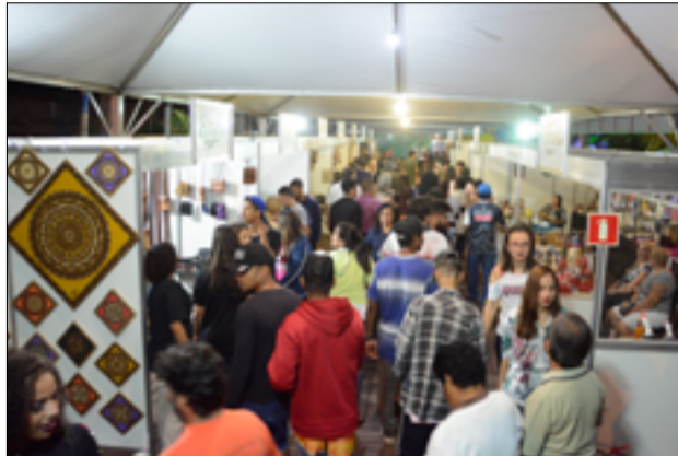
Pavilhão dos Países é uma das atrações do evento