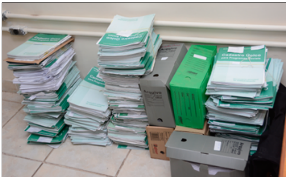
Documentos e arquivos apreendidos pela PF durante cumprimento de mandados de busca

A Polícia Federal informa que eventuais informações sobre as suspeitas de irregularidades do programa podem ser encaminhadas pelo telefone (67) 3234-7804. O sigilo da fonte é garantido.