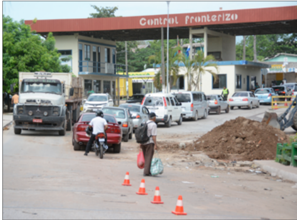
Tráfego de veículos ficou impedido durante os dias de manifestação; ontem o trânsito foi retomado