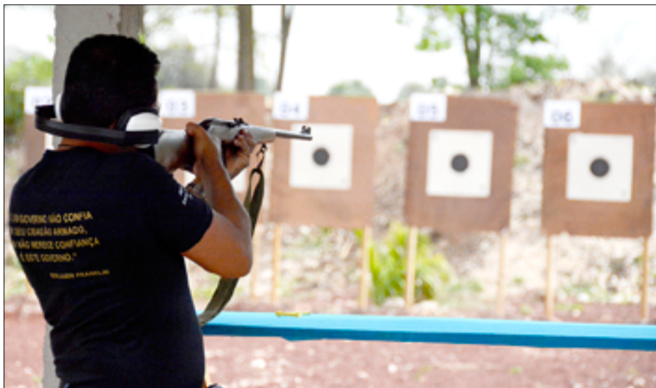
Tiro prático é novidade na edição deste ano; é um esporte desafiador