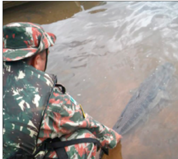
Piracema é o período de reprodução dos peixes nos rios de MS

inteligência à paisana também vão atuar e identificar quem praticar a pesca ilegal. Drones serão usados para acompanhar os cardumes, evitar a pesca e identificar pescadores ilegais e embarcações