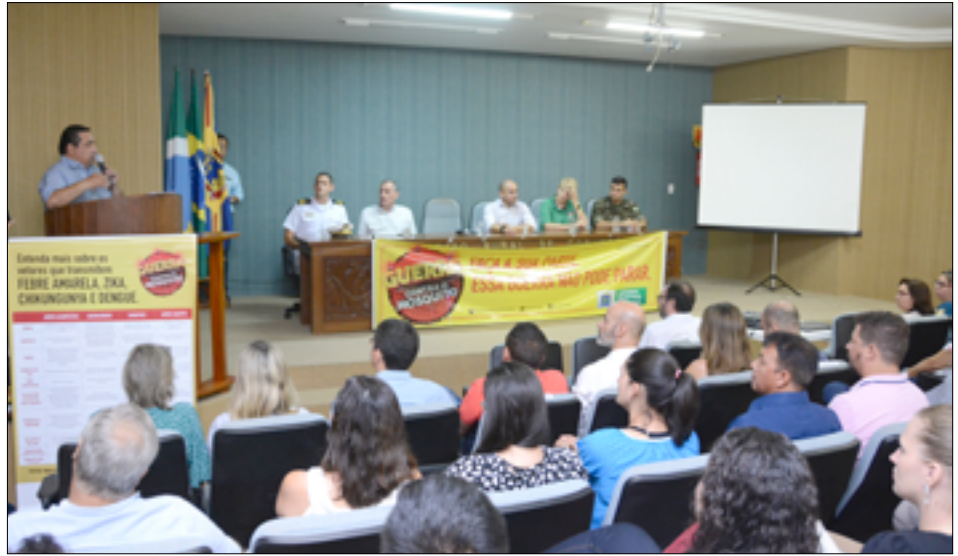
Lançamento do Plano de Contingência aconteceu ontem no auditório do Sindicato Rural

da Marinha do Brasil e Exército Brasileiro, estão engajados no trabalho. "Vamos intensificar ainda mais os trabalhos de prevenção e orientação, para que não tenhamos que enfrentar uma epidemia. Por isso, a parceria com instituições, como Marinha e Exército, é fundamental, todos de-