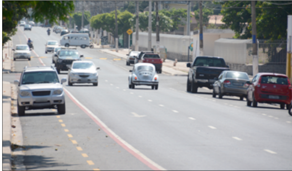
Motoristas devem ficar atentos às mudanças; estacionar na ciclofaixa, por exemplo, é proibido

tação estão sendo instaladas em toda essa área que corresponde às mudanças. Todas as esquinas terão uma placa de sentido único direcionando o motorista, motociclistas, pedestres e ciclistas. Essas regras começam a valer neste sábado (09), porém ainda iremos dar um período de adaptação, alertando os motoristas sobre as mudanças, com ações edu-