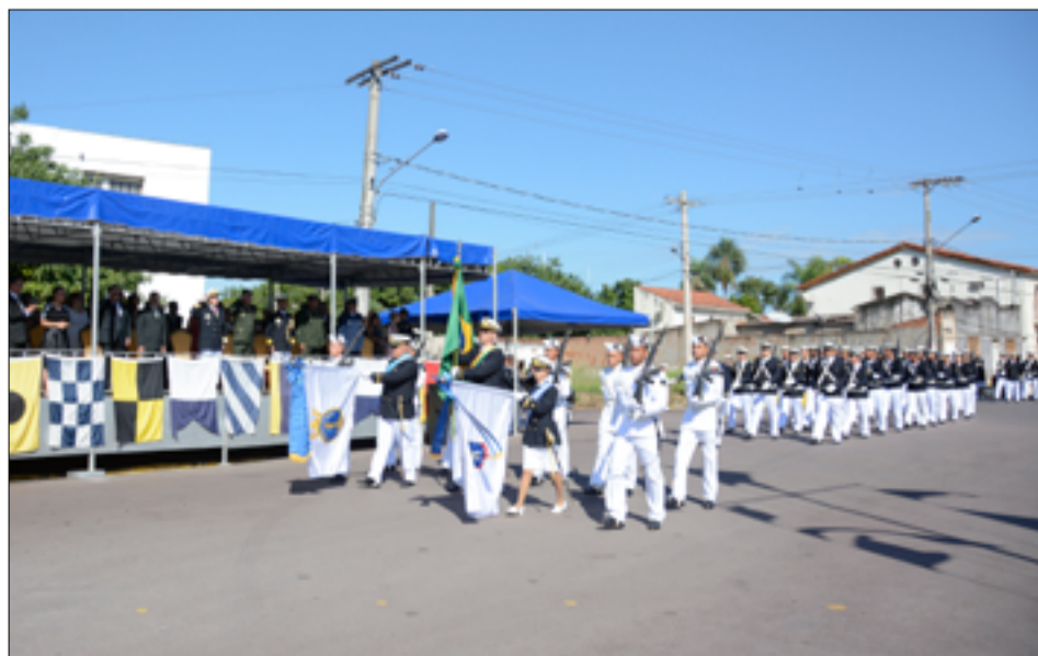
Solenidade marcou homenagens à Data Magna da Marinha