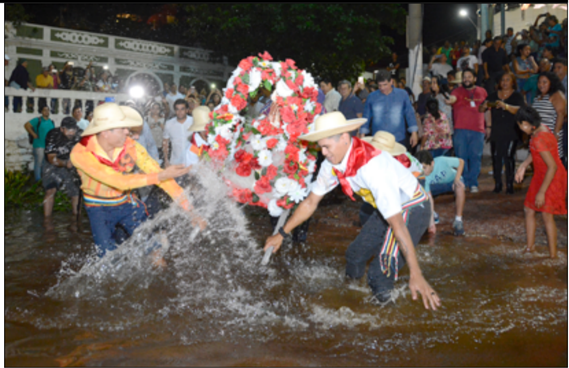
Anderson Gallo/Arquivo Diário