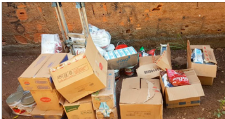
Todos os produtos foram recuperados pelos policiais

por volta das 02h desta quarta-feira, 12 de junho, no bairro Ma-