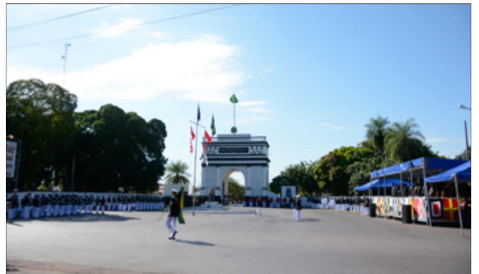
Cerimônia aconteceu em frente ao Pórtico do 6º Distrito Naval em Ladário

"Para garantir a defesa dessa área, a nossa Amazônia Azul, a Marinha vem desenvolvendo seus Programas Estratégicos.