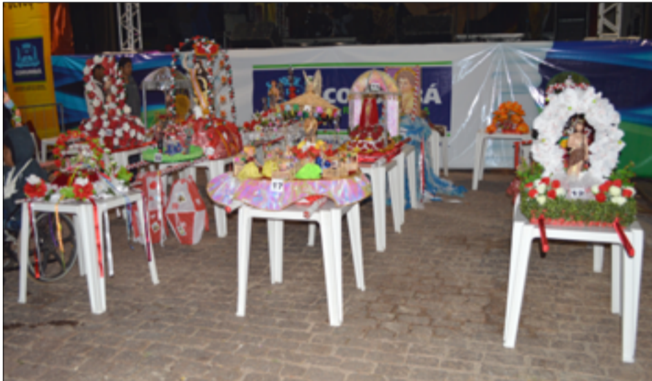
Concurso de andores vai premiar os três primeiros colocados