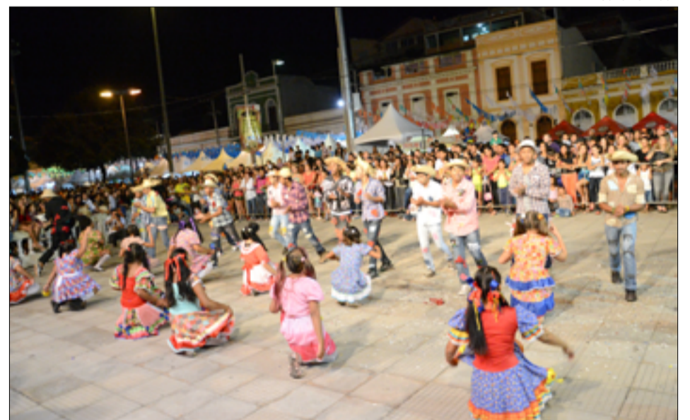
Grupos só poderão ter componentes acima de 14 anos para disputar o concurso de quadrilhas