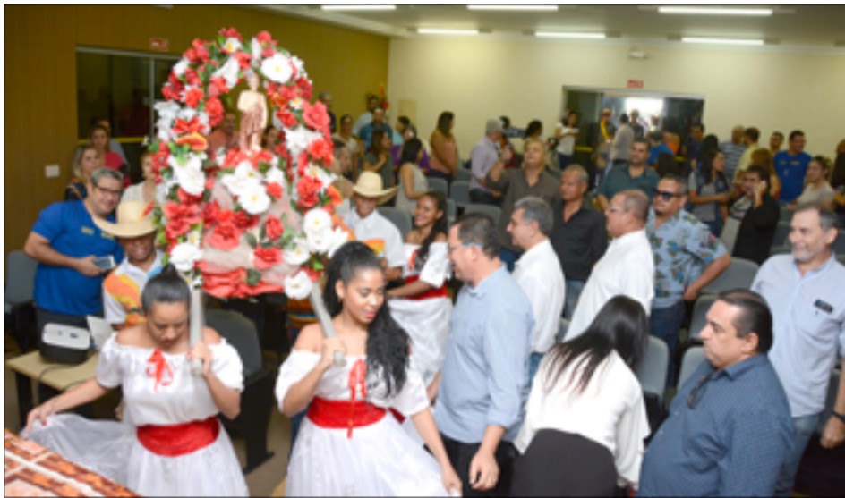
Anúncio de programação foi aberta com andor de São João, carregado pelos alunos da Oficina de Dança

do Executivo Municipal ao destacar a importância do evento para a cidade ao lembrar que, assim como faz o carnaval, o São João "movimenta fortemente a economia" local. "Teremos mais de 90% dos cantores, das atrações, daqui da nossa cidade. O evento é uma oportunidade para mos-