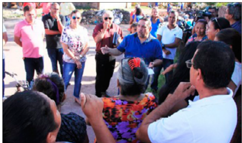
Prefeito Marcelo Iunes durante conversa com moradores

As ações diversas são voltadas para o desenvolvimento de áreas de recreação e descanso, infraestrutura de vias e drenagem, recuperação do patrimônio histórico e fomento do turismo.