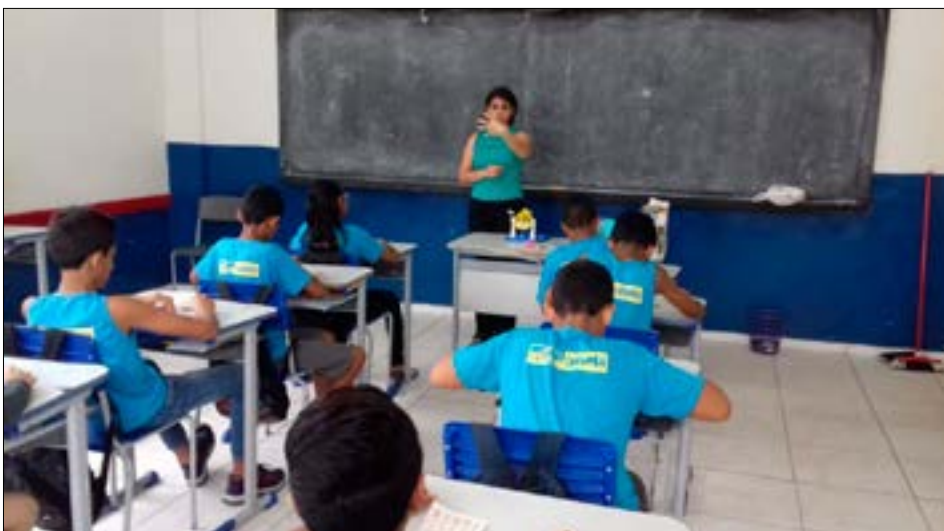
Cadastro é requisito para o professor contratado ministrar aulas temporárias na Reme

DA REDAÇÃO contato@diariocorumbaense.com.br