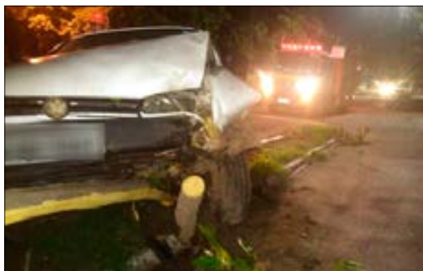
Na colisão, árvore caiu na via e precisou ser cortada pelos bombeiros

quinta-feira (03), passando a avenida Nossa Senhora da Candelária. Cinco pessoas (o motorista, 2 mulheres e 2 crianças) estavam no veículo Gol, que colidiu contra uma árvore. Os ocupantes não sofreram lesões e recusaram atendimento da equipe dos bombeiros. O condutor, de 33 anos, apresentava forte odor etílico, caracterizando embriaguez, e a Polícia Militar registrou o caso. A árvore do canteiro central caiu na via, interrompendo o tráfego, e teve de ser cortada pela guarnição do 3º Grupamento. (RN)