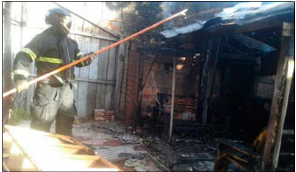
Incêndio ocorreu na manhã de quinta-feira

Incêndio em casa de madeira, mobilizou o Corpo de Bombeiros de Corumbá às 07h de quinta-feira (03). Foi na rua Delamare, no local conhecido como "Beco do Borrowisk".