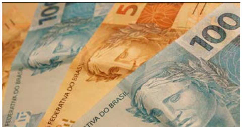
Decreto foi assinado pelo presidente Jair Bolsonaro