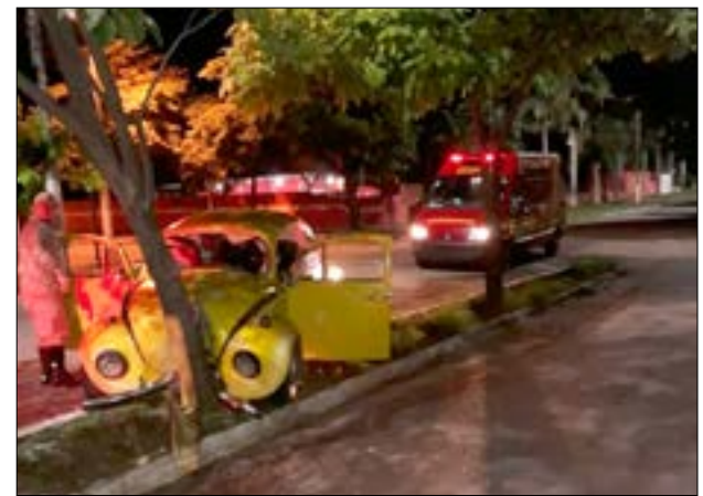
Primeiro acidente ocorreu na madrugada do ano novo

Quatro pessoas ficaram feridas após o condutor de um Fusca bater contra uma árvore na avenida Rio Branco, que liga Corumbá a Ladário. O acidente foi às 03h40 de terça-feira, 1º de janeiro.