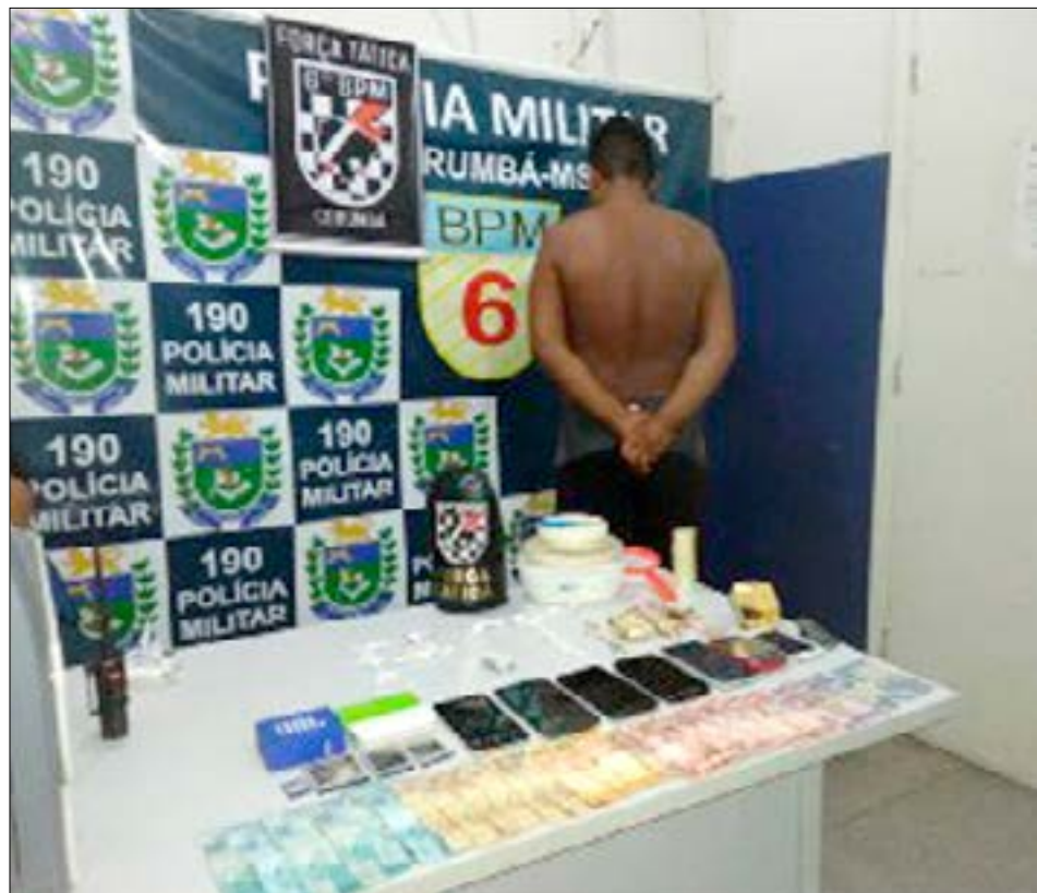
Homem de 27 anos preso; droga e dinheiro apreendidos

ROSANA NUNES rosana@diariocorumbaense.com.br